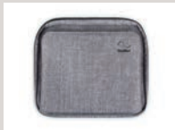
Premium-Reisetasche für AirMini