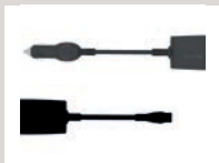
12/24 V Gleichspannungs- wandler